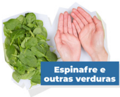
Espinafre e outras verduras