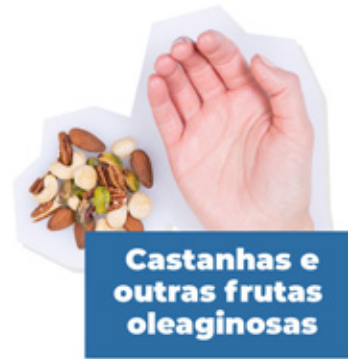
Castanhas e outras frutas oleaginosas