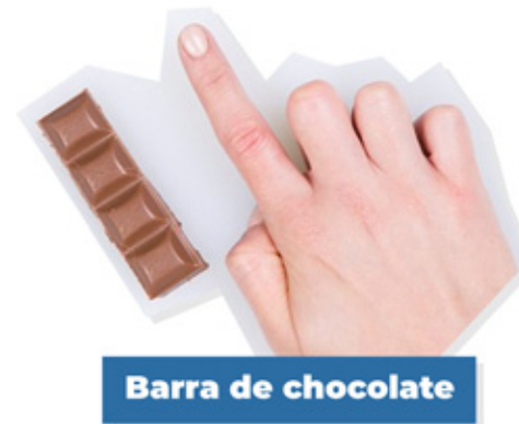
Barra de chocolate