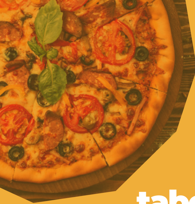
tabela de alimentos