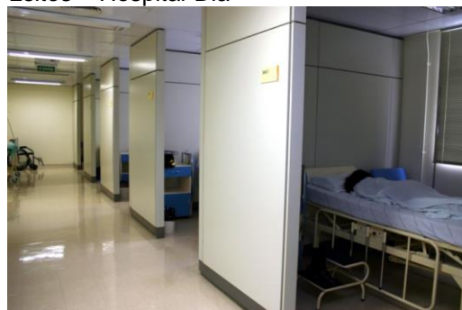
Leitos – Hospital-Dia